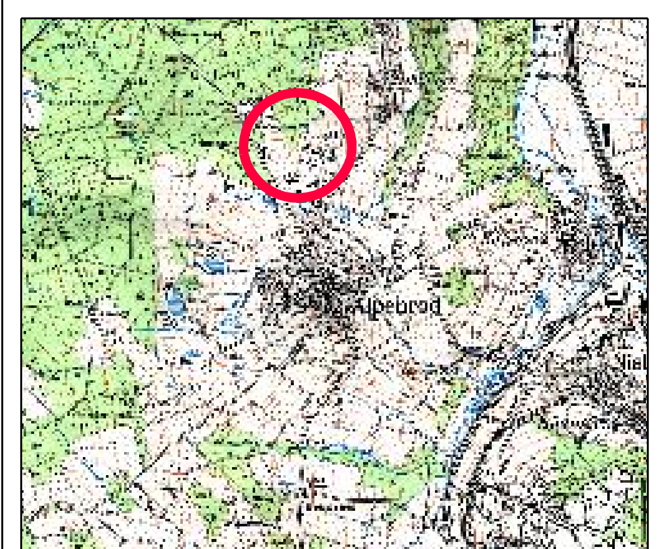
Aus der Topographischen Karte im Maßstab 1 : 25.000